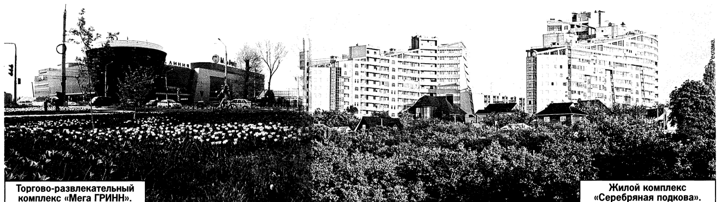
Торгово-развлекательный комплекс «Мега ГРИНН».

Наиболее интересными и значимыми работами этой творческой мастерской являются проекты комплексов жилых и общественных зданий в п. Дубовое, в областном центре на ул. Горького, храма Святой Троицы в п. Комсомolec, ряда жилых домов в городах Московской области.