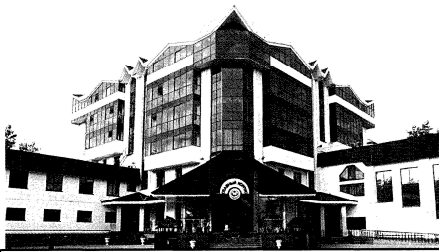
Идеи проектировщиков воплощены в здании главного корпуса санатория «Красиво».

Институт связывают с Белгородчиной стабильные партнерские отношения. По проекту наших украинских коллег построено здание торгово-развлекательного комплекса «Мега ГРИНН», выполнена реконструкция корпусов Белгородской областной клинической больницы Святытеля Иоасафа, осуществляется строительство многоквартирных домов в Белгороде и других городах Белгородской области.